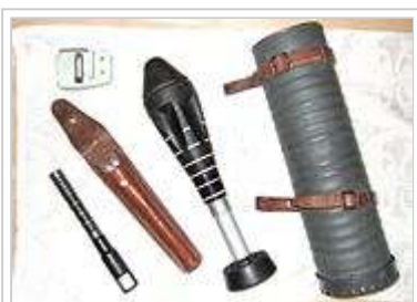
Übungs-Wurfgranate 48 mit Wechselmagazin, Schiessbecher späterer Art, Schiessbecherfutteral und

Im Zweiten Weltkrieg wurde erstmals Hohlladungsmunition in grösserem Umfang verwendet, vor allem im Spreng- und Panzerabwehrbereich. In der schweizerischen Armee wurde mit der Panzerwurfgranate der Truppe ab 1943 ein Panzernahbekämpfungsmittel auf dieser Basis zugeführt. Die